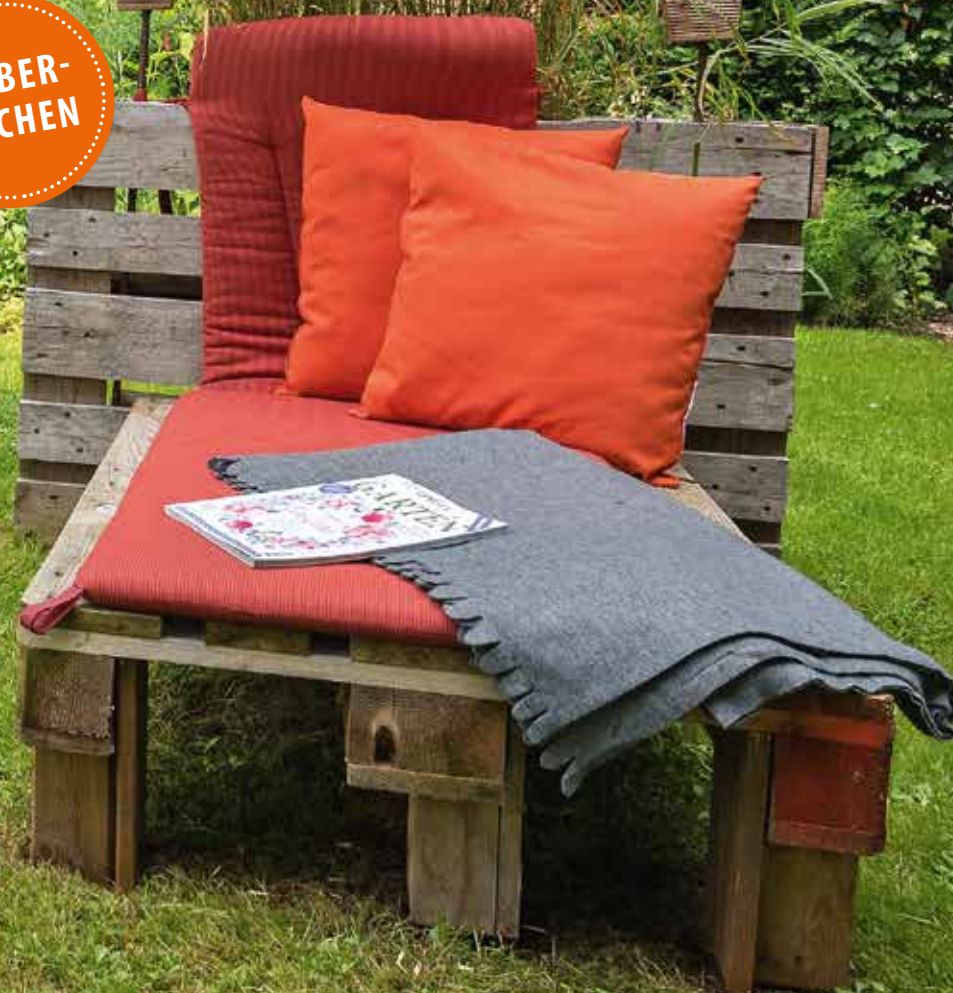
IDEE, UMSETZUNG & FOTOS: PETER KÖSTEL