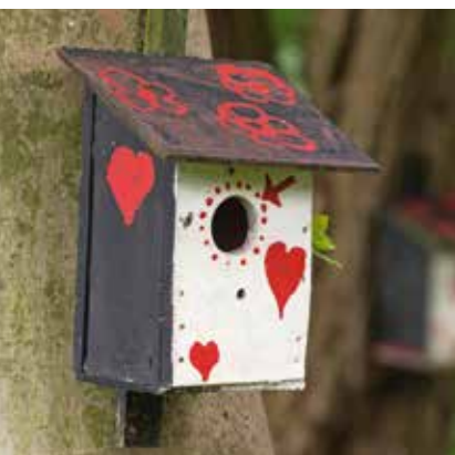
Blickpunkte und Sichtachsen gehören zur Gartenphilosophie der Köstels. Die Buchenhecke mit Bogen eröffnet das Rondell im oberen Teil des Grundstücks (o.). Tierische Gartenbewohner jeglicher Art sind auf dem Hang jederzeit herzlich willkommen (Mi.). An die Holzterrasse grenzt der kleine Naschgarten mit Himbeeren und anderen Leckereien (u.).